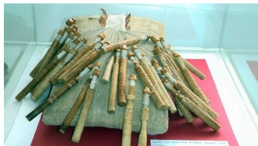
Lepoglavska čipka – dedek in bateki

To je nežna čipka, ki jo izdelujejo iz lanenih in bombažnih niti na okroglem trdnem podstavku s parnim številom lesenih kije, tzv. dedeka in batekov. Čipka nastaja na narisani predlogi, niti pa se prepletajo tako, da reliefno poudarjajo oblike posameznega motiva. Motivi pa so v glavnem iz živalskega in rastlinskega sveta.