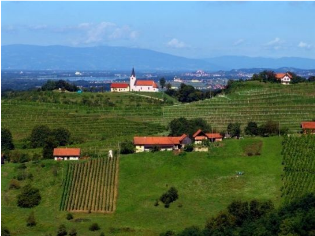
Haloška in Zagorska pokrajina – Cerkev Sv. Ane

Po Halozah in Zagorju je speljanih več kolesarskih poti. Čeprav se precej razlikujejo po svojih težavnostnih in dolžinah, pa je vsaka po svoje zanimiva in privlačna.