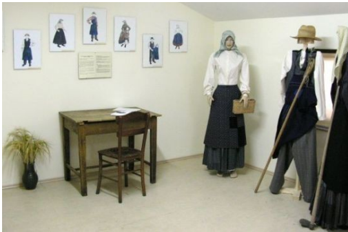
Haloška in Zagorska noša

Iz spominov in pričevanj svojih še živečih staršev in starih staršev ter z ohranjenih fotografij so člani Folklornega društva Pobrežje spoznali, razbrali in razvozlali vse posebnosti in zanimivosti kmečke vsakdanje kakor tudi nedeljske praznje noše v svojem kraju. S strokovno pomočjo so izdelali skice, pripravili krojne pole in tudi sešili oblačila iz druge polovice 19. stoletja, ki so se ohranila nekako do prve ali celo druge svetovne vojne. Ker raziskujejo in gojijo tudi plese iz tega obdobja, zdaj v teh oblačilih nastopajo na številnih prireditvah.