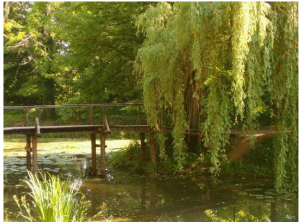
Jezero v Arboretumu Opeka